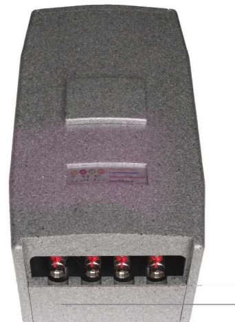
Beispielfoto Artikelnummer: EPP - Isolierung

Technisches Datenblatt finden Sie unter: