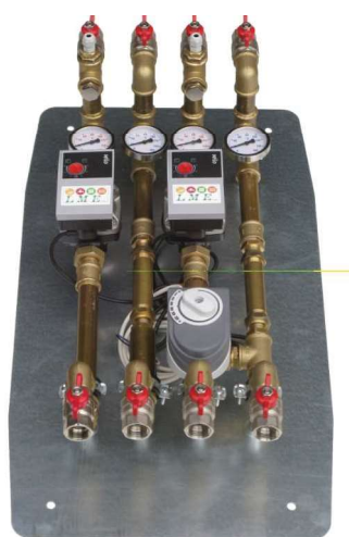
Beispielfoto Artikelnummer: MK200 + PS - WMZ