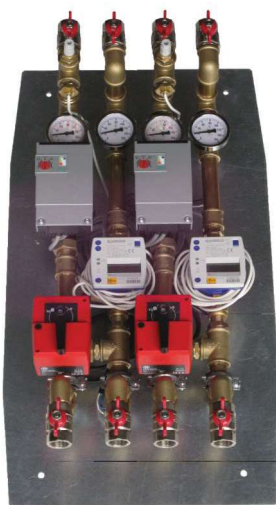
Beispielfoto Artikelnummer: MK220 + MKMM + WMZF