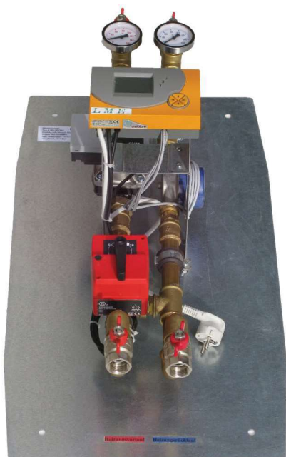
Beispielfoto Artikelnummer: MK20 + WKWR + MWMZ15