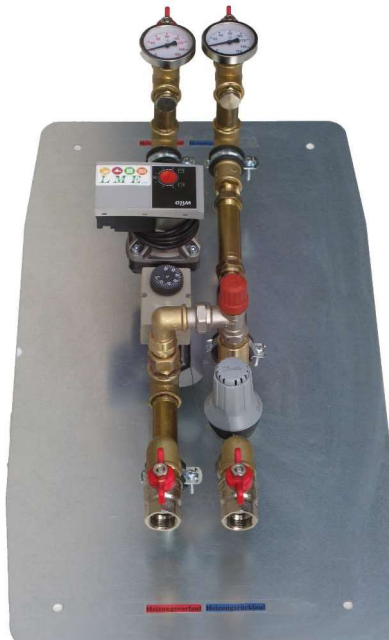
Beispielfoto Artikelnummer: FK20