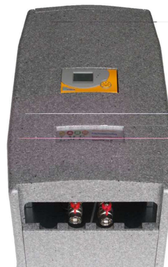
Beispielfoto Artikelnummer: EPP - Isolierung

Technisches Datenblatt finden Sie unter: